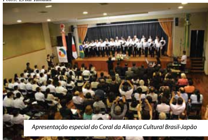
Apresentação especial do Coral da Aliança Cultural Brasil-Japão