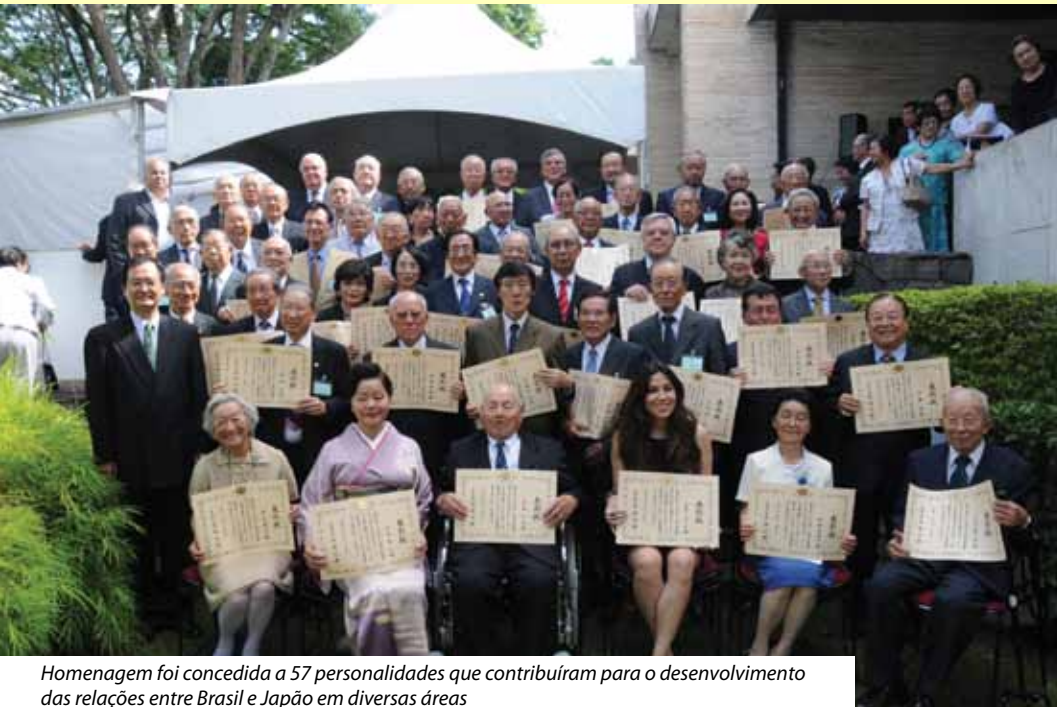
Homenagem foi concedida a 57 personalidades que contribuíram para o desenvolvimento das relações entre Brasil e Japão em diversas áreas