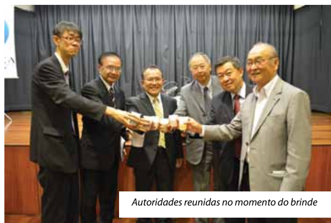
Autoridades reunidas no momento do brinde