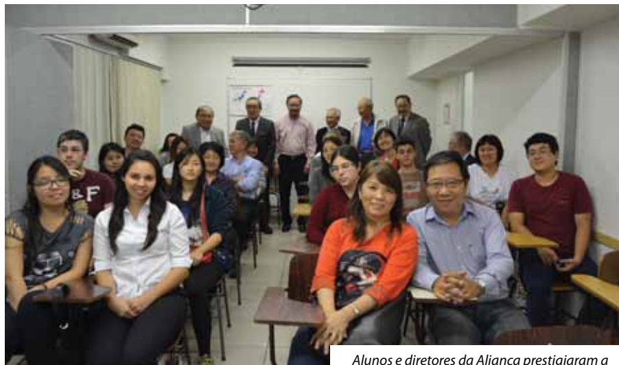
Alunos e diretores da Aliança prestigiaram a discussão sobre "O Papel do Nikkei"

A Aliança Cultural Brasil-Japão não se responsabiliza pelos conceitos e opiniões emitidos em artigos assinados, que são de inteira responsabilidade de seus autores.