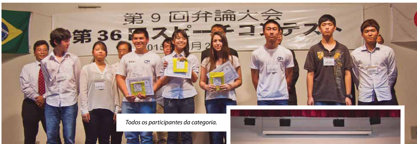
Todos os participantes da categoria.