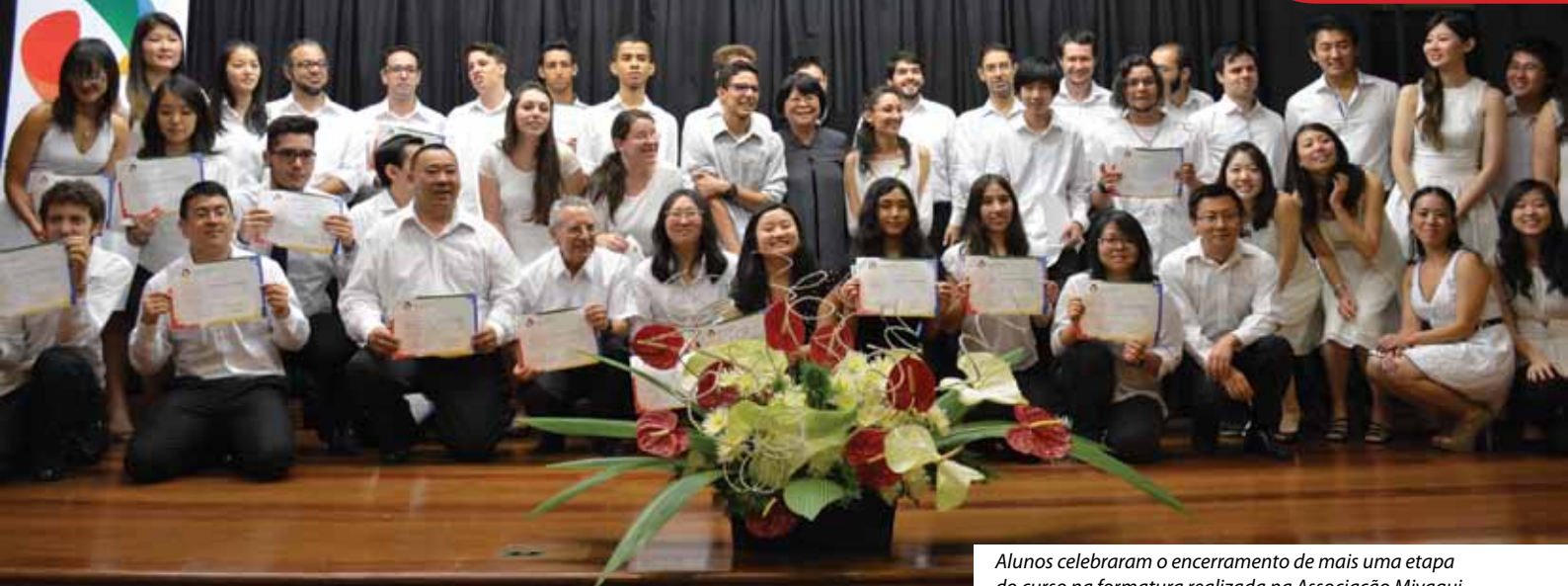
Alunos celebraram o encerramento de mais uma etapa do curso na formatura realizada na Associação Miyagui